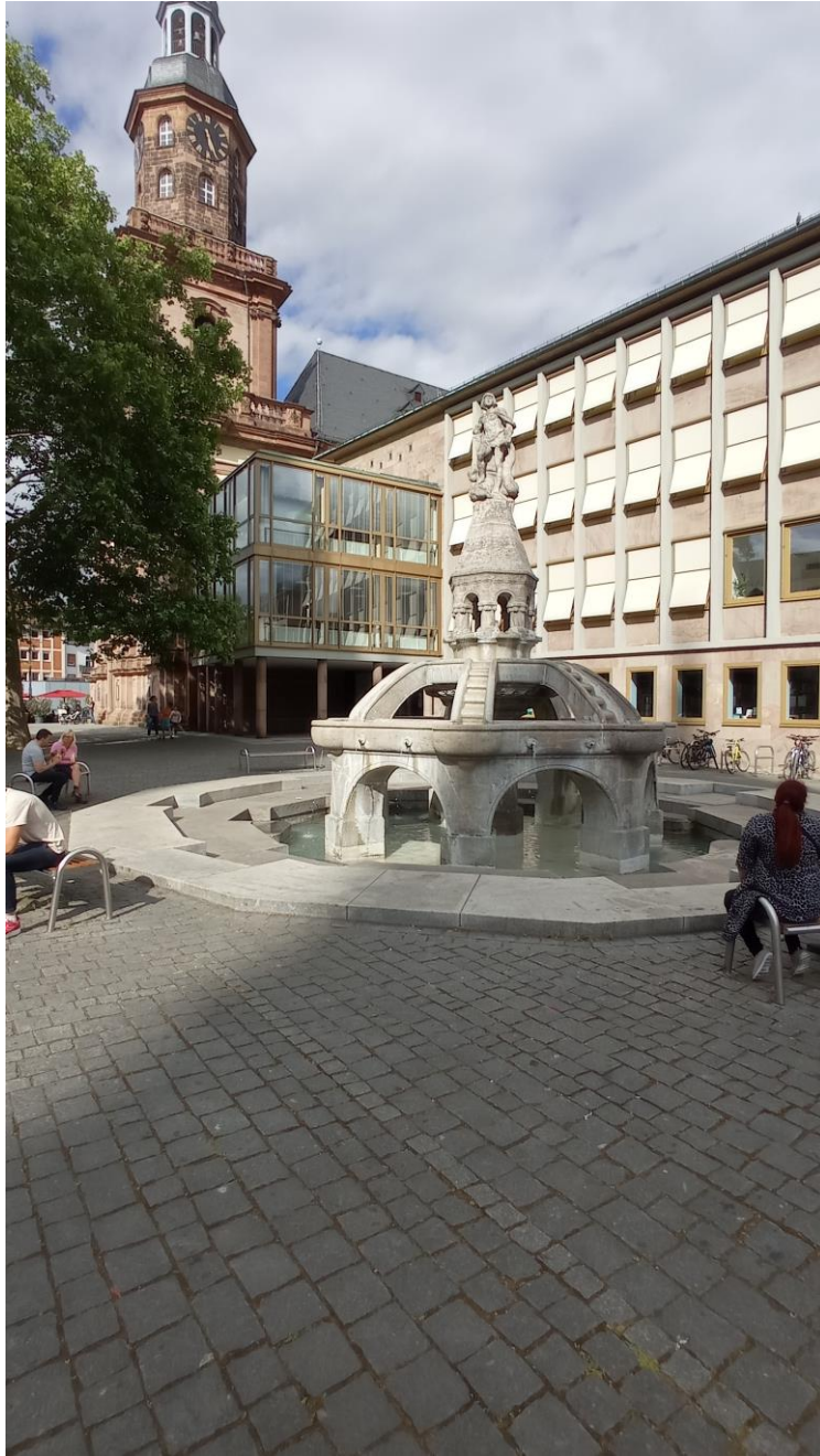
Der Siegfriedbrunnen vor dem „Haus der Münze“