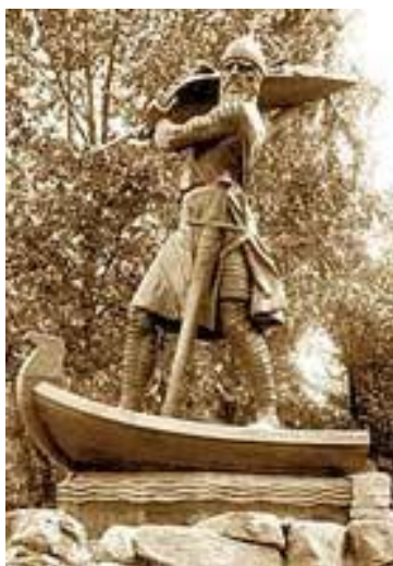
im Wormser Wäldchen

Hagen-Denkmal