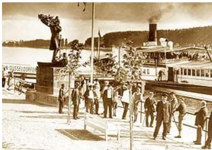
am Wormser Rheinufer (ab 1932)