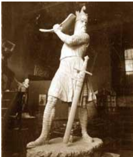
Entwurf der Hagen-Statue